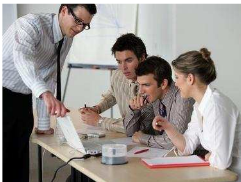
Ihrem Weg.